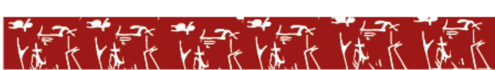
Imagem VI - Cabide ou espelho?