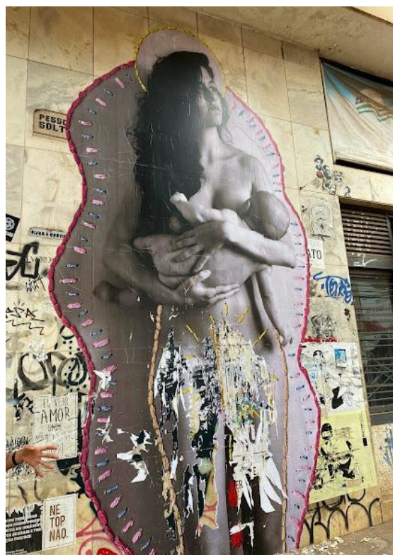
Imagem VII - Viva la vulva - mas em Goiânia não

dois não pode”. Na verdade, o conservadorismo e misoginia que aparecem na incapacidade de aceitar uma vulva pode ser pensado e relacionado de diversas maneiras, mas sabemos como ele se faz presente na vida de todas nós. E nesse espaço, que tem misóginos e conservadores, também tem gente que brinca, que faz arte, que constrói a cidade que se quer, que faz dela habitável e lugar onde se pode amar, como uma poesia na parede mostra.