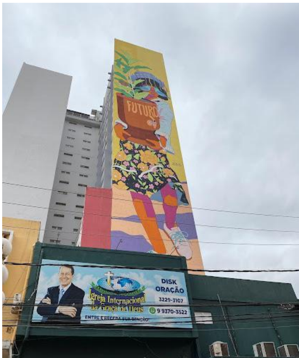
Imagem 9 - O futuro está no céu, o inferno abaixo dele

acima o grafite de Wes, que representa uma jovem segurando o “futuro”, que me fez pensar que o futuro está mesmo no céu, porque o inferno está abaixo dele.