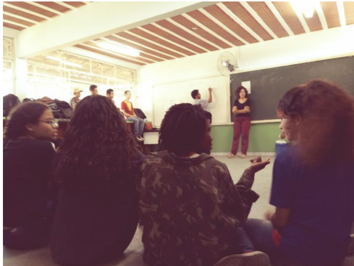
Aula de história do hip hop e prática de break dance .

graffiti (a pintura de murais com traços característicos). O movimento hip hop torna-se, assim, um rico direcionador para o estudo histórico das diásporas e movimentos migratórios, compreendendo até a contemporaneidade, já que o movimento artístico retorna para a América Latina, dando origem a novas manifestações das culturas periféricas ao sul do Rio Grande 7 .