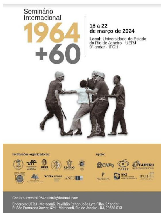
Imagem 1 - Cartaz de Divulgação do Seminário Internacional 1964 + 60