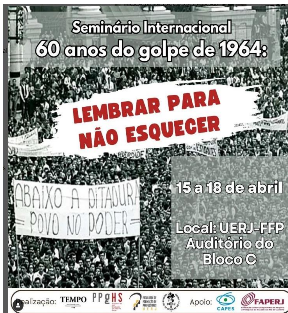
Imagem 3 - Cartaz de Divulgação do Evento