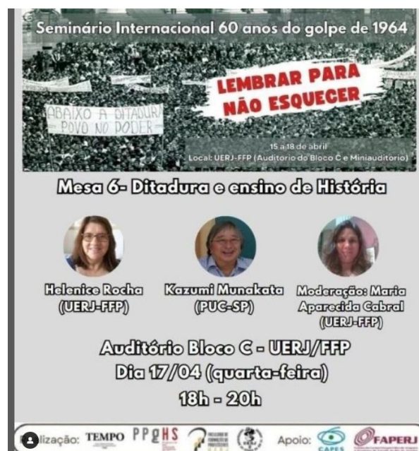
Imagem 5 – Cartaz de Divulgação da Mesa 6