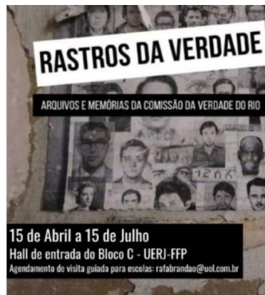
Imagem 4 - Cartaz de Divulgação do Evento